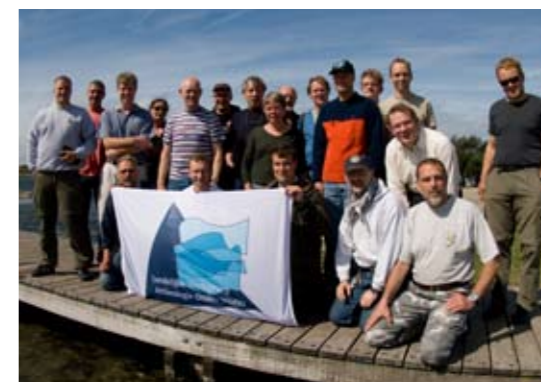
Opleiding Deelnemers van LWAOW basiscursus na het praktijkgedeelte.