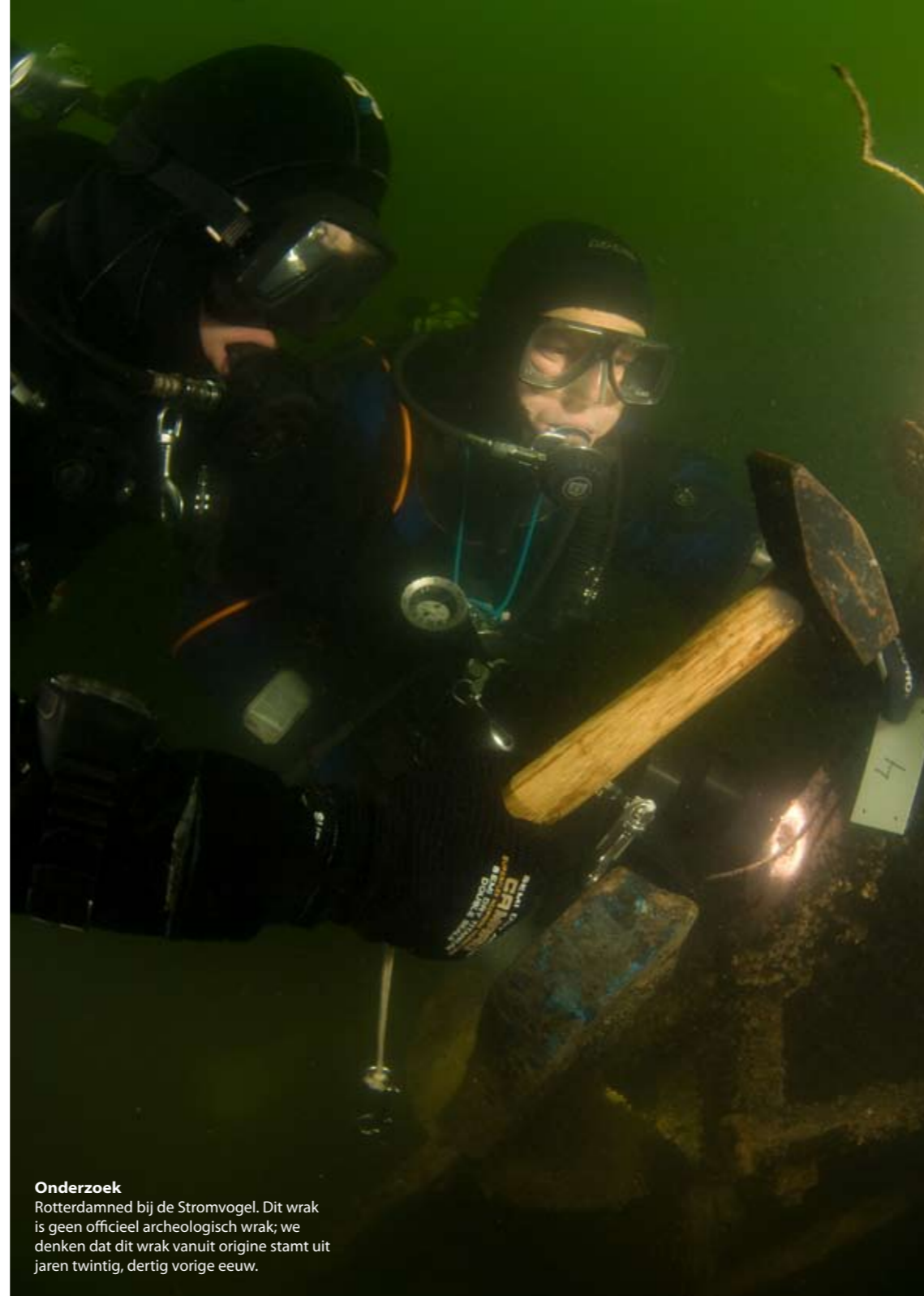
Onderzoek Rotterdamd bij de Stormvogel. Dit wrak is geen officieel archeologisch wrak; we denken dat dit wrak vanuit origine stamt uit jaren twintig, dertig vorige eeuw.

En dat terwijl bij de aanleg van Maasvlakte2 verwacht wordt tegen verschillende archeologische vondsten aan te lopen. Als oplossing voor het ruimtegebrek denkt het RACM eraan het Oostvoornse Meer als depot te gebruiken. Ook op het geldprobleem is iets gevonden. Het Verdrag van Malta stelt namelijk grondeigenaren in Nederland sinds 2006 verantwoordelijk voor het beschermen van cultureel erfgoed dat zij tijdens werkzaamheden in de bodem aantreffen. Havenbedrijf Rotterdam, dat de Maasvlakte aanlegt, heeft drie miljoen euro uitgetrokken