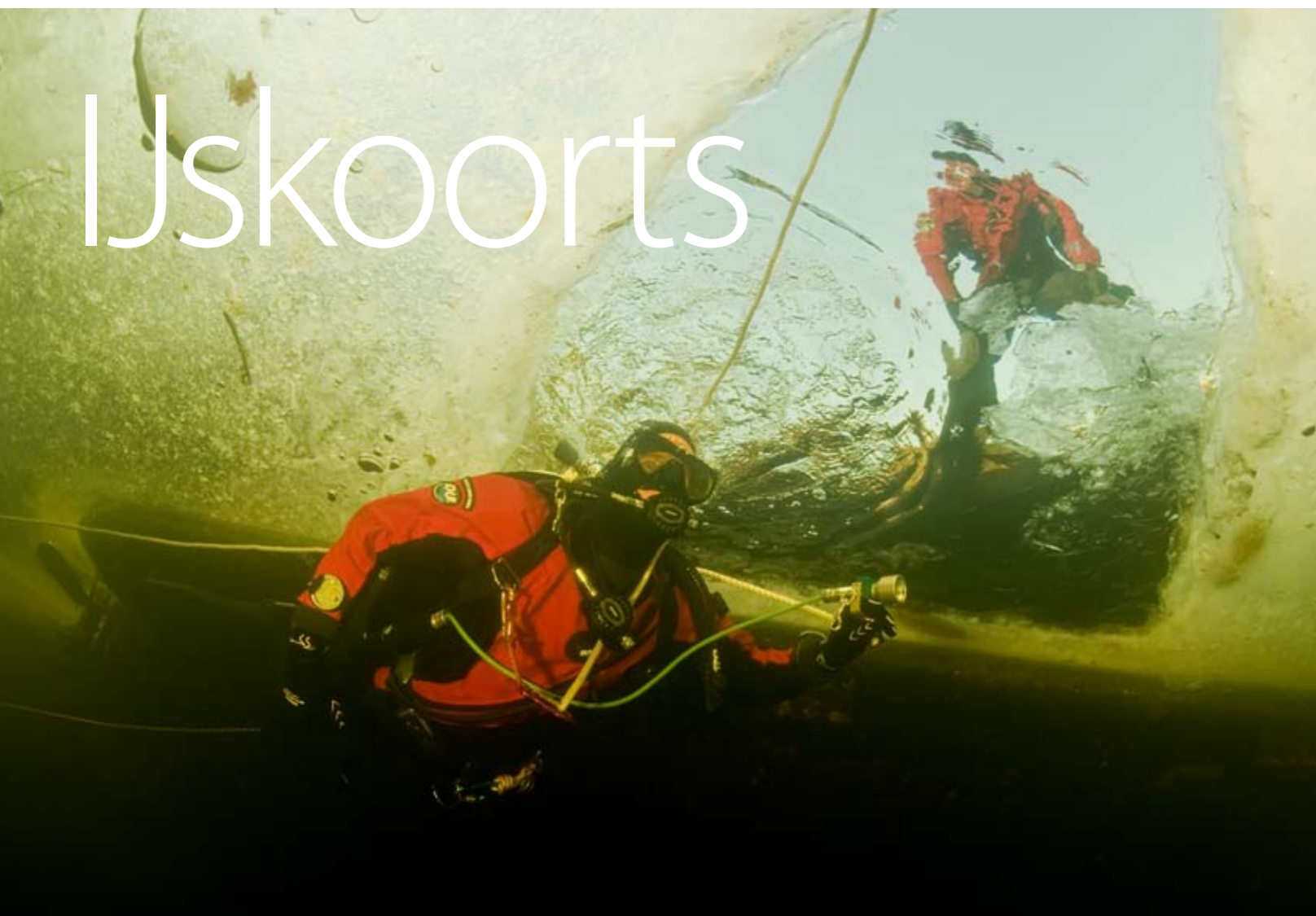
Onder het ijs - Een gidslijn wijst de weg.

Mijn duikset is na een eerste duik stijf bevroren. De knoppen op de inflator zitten muurvast: het is maar lastig ontluichten als ik voor de tweede keer op deze vrieskoude winterse dag onder het ijs wil duiken. Een materiaalprobleem, maar daar laten we ons niet door weerhouden.