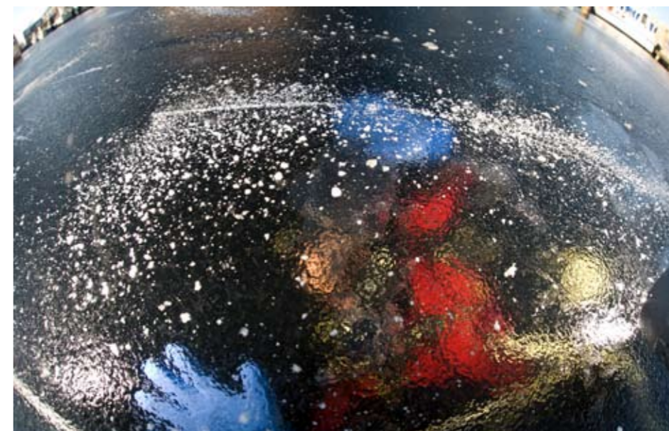
Plafond - Het mooiste is om op je rug tegen de ijsvloer aan te plakken.

» Het zet je aan het denken: zonder lijnen mag je van geluk spreken als je de instap weer terug vindt.